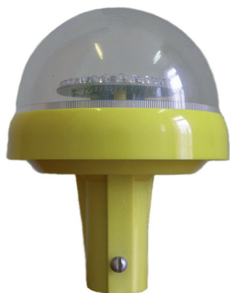
ЗОМ ППМА-К-220 ФОТО